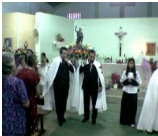
Sábado 24 de Junio del 2006 – Procesión en la Parroquia San Juan Bautista de Villa Hayes.

Y nuevamente estuvo el Temple honrando con sencillez y humildad, ese anuncio, ese grito en el desierto, esa voz que sigue aguardando a que los hombres conozcan, pues aquellos que lo hagan, renacerán en Dios y no en la sangre y en el deseo de los hombres.