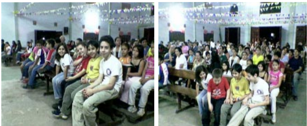
Escuderos del Temple.

La noche caía lentamente, mientras..... la procesión iba despacio acercándose de nuevo a la Parroquia, una fila de velas decoraban el pórtico, despacio iban los feligreses a depositar sus iconos.